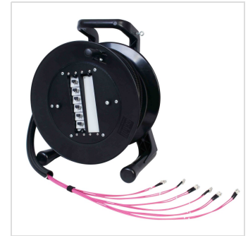
Konfektionierte Kabeltrommel LC-LC