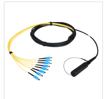
Konfektioniertes Kabel Eurolens 8-fach-SC geschlossen