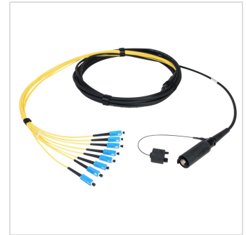
Konfektioniertes Kabel Eurolens 8-fach-SC