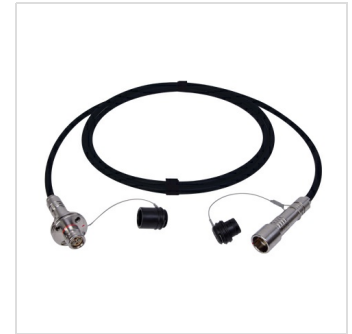
Konfektioniertes SMPTE-Kabel FMW-PUW