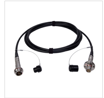
Konfektioniertes SMPTE-Kabel PEW-FMW