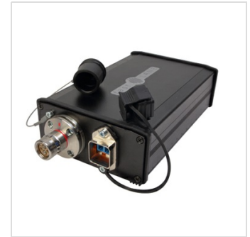
Übergabebox FXW – LC